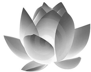
Flor de Loto

En la India, la idea de reencarnación era ya parte del contexto en el que nació el budismo, pero éste prefiere el término "renacimiento" en vez de "reencarnación", debido a que no afirma la existencia un alma perdurable que pueda transmigrar. Así, el renacimiento en el budismo no es igual que la reencarnación en el hinduismo. Para entender el renacimiento es necesario entender también el concepto de anatta : En el renacimiento budista, el proceso del karma hará que la existencia de seres conscientes se manifieste, pero no existe un alma o espíritu eterno. Así, las acciones de cuerpo, como el habla y el pensamiento, conllevan efectos que se experimentarán con el tiempo, ya sea en la vida actual o siguiente. La continuidad entre individuos la constituye esa corriente causal, que es manifestada como tendencias y circunstancias en sus vidas. El renacimiento no es visto como algo deseable, ni significa un determinismo o destino. El camino budista sirve para que la persona pueda liberarse de esa cadena de causas y efectos (o karma ). Mientras no exista un cese de este ciclo, nuestra vida es samsárica . Si bien el individuo debe experimentar las circunstancias en las que le toca vivir, a la vez es el único responsable de lo que decida hacer frente de ellas.