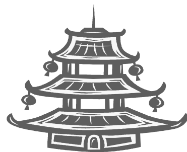
Templo Budista - Stupa

A pesar de que cambian su arquitectura según la región, las Stupas (monolitos conmemorativos de la Iluminación de Buda) conservan una morfología similar entre las diferentes culturas budistas.