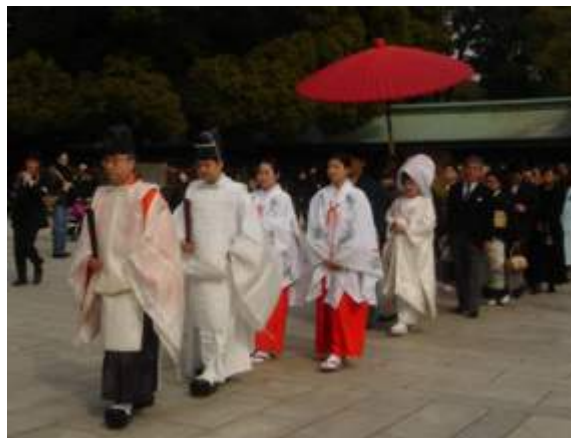
Boda Sintoísta en Japón

Las prácticas religiosas principales debieron de ser los matsuri , que eran ofrendas y ritos para implorar a los Kami. Constaban de una fase en la que se intentaba atraer al Kami, congraciarse con él mediante ofrendas de arroz o pescado y especialmente de sake (aguardiente de arroz tenido por una bebida de índole misteriosa), para implorarle favores o pedirle que desvelase el futuro. Estas ceremonias se realizaban junto con banquetes comunitarios, cuyos participantes caían en trances provocados por la ingestión de sake , y se acompañaban de procesiones ( miyuki ) y de enfrentamientos rituales: lucha con espada, carreras de caballos o tirar de una soga. Se cree que tenían la finalidad de unir al grupo y favorecer la toma de decisiones.