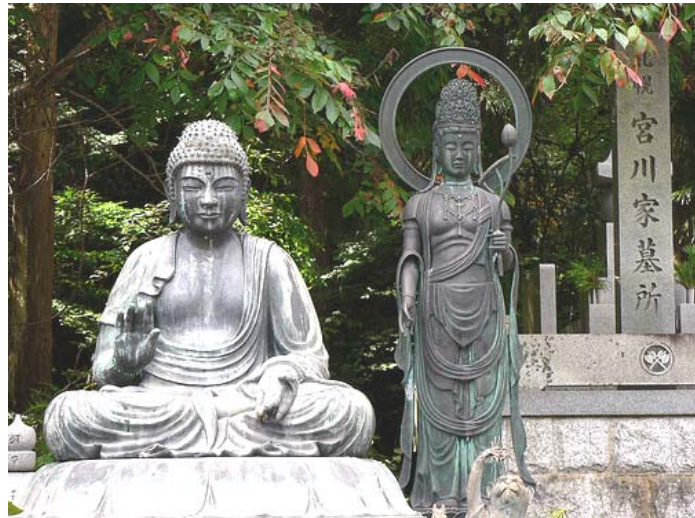
La imagen presenta el claro sincretismo en Japón, con BUDA a la izquierda y AMATERASU a la derecha, en mismo santuario.

En el siglo XIII, las más importantes familias sacerdotales de ISE y KYOTO, desarrollaron doctrinas que disociaban en forma explícita el Shinto del Budismo. El Shintoísmo y el Budismo fueron separados por un decreto en 1868, pasando el primero a ser el credo del Estado: fueron sacadas todas las efigies budistas de los santuarios shinto, y todos los vestigios del budismo fueron retirados de la casa familiar imperial. A los sacerdotes se les convirtió en empleados del Estado, y los ministros religiosos pasaron a estar bajo las detalladas instrucciones doctrinales y rituales de un nuevo sistema llamado sintoísmo estatal. Estas reformas se realizaron en los santuarios más importantes; en general las prácticas folclóricas sintoístas no fueron alteradas y se permitió a algunas de las ramificaciones religiosas marginales que databan del periodo Edo continuar con sus prácticas, pero bajo la dirección del Shinto.