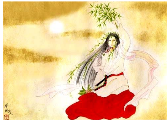
La diosa AMATERASU.

AMATERASU, es la suprema divinidad solar del Shintoísmo japonés y legendaria antepasada de la familia imperial, cuyo nombre completo es AMATERASU OMIKAMI (“Gran Espíritu que ilumina los Cielos”). Es casi la única diosa con estas características dentro de las religiones politeístas del mundo, en las que la abrumadora mayoría posee dioses solares masculinos. Existen distintos relatos respecto a su origen. Según las crónicas de NIHON SHOKI (720), esta diosa habría nacido como fruto de las relaciones entre IZANAGI e IZANAMI, la pareja original; mientras que el escrito KOJIKI (712) afirma que habría nacido del ojo izquierdo de IZANAGI, cuando éste se lo habría ido a lavar después de visitar el infierno.