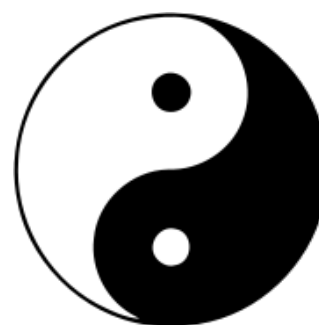
Taijitu, Símbolo emblemático del Taoísmo

Puede ejemplificarse esta concepción a partir del significado de las palabras: "Yang" literalmente significa la ladera luminosa (soleada) de la montaña, y "Yin" la ladera oscura (sombria) de la montaña; entiéndase la idea de montaña como símbolo de "unidad". Así, aunque representan dos fuerzas aparentemente opuestas, forman parte de una única naturaleza. La igualdad entre las dos primeras fuerzas entraña la igualdad de sus manifestaciones consideradas en abstracto. Por ello el taoísta no considera superior la vida sobre la muerte, no otorga supremacía a la construcción sobre la destrucción, ni al placer sobre el sufrimiento, ni a lo positivo sobre lo negativo, ni a la afirmación sobre la negación. Las cosas cotidianas e insignificantes tienen un significado mucho más profundo del que nosotros le damos.