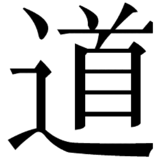
Sinograma del Tao.

El dios de la fe patriarcal primitiva de China era el cielo, y el Emperador era el hijo predilecto del cielo y su único intermediario. Para destronar al tirano reinante, la noble familia Chou, Lao-Tsé invierte estos planteamientos. La nueva divinidad de Lao-Tsé no es ya el cielo, sino el TAO. El cielo queda en segundo lugar, en un plano inferior sometido al Tao. Lao-Tsé explica el Tao en su escrito Tao-Te King aunque éste no es un tratado teológico. Inútilmente encontraremos una doctrina sistemática bien definida en sus distinciones y aclaraciones sobre la naturaleza y atributos del Tao. Es un libro sapiencial (de sabiduría), un tratado de perfección con documentos para la vida privada y para la vida social del hombre perfecto, del sabio. Los 81 capítulos son breves esquemas de lecciones, que comienzan estableciendo un principio doctrinal y terminan con una aplicación práctica, proponiendo una virtud del Tao a imitar, o una sabia norma de conducta para la vida. Muchos discípulos y autores, que más tarde interpretaron la naturaleza metafísica del Tao-Te King, desarrollaron extensos comentarios sobre cómo debería entenderse el libro (interpretación). Algunas explicaciones se ramificaron en creencias y supersticiones relacionadas apenas remotamente con las enseñanzas del taoísmo.